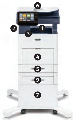
Xerox® VersaLink® B605 többfunkciós nyomtató Nyomat. Másol. Szkennel. Faxol. E-mailt küld.